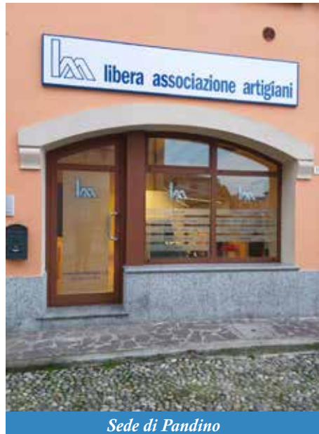
Sede di Pandino