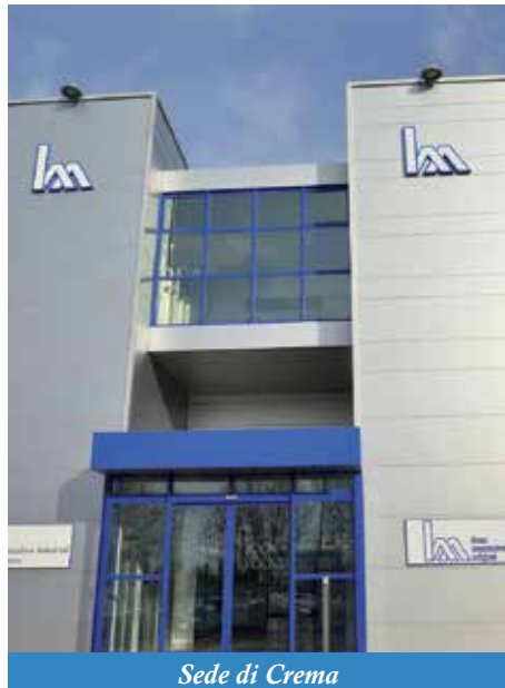
Sede di Crema

Dopo i recenti chiarimenti dell'Agenzia delle Entrate tutti i dubbi possono essere sciolti in una delle tre sedi del territorio dove opera l'Associazione