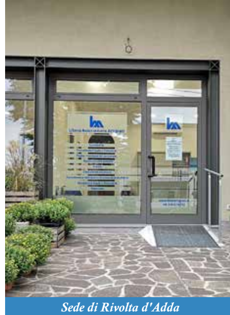
Sede di Rivolta d'Adda

In un nostro precedente contributo avevamo già affrontato il tema del Bonus Affitti 2020 , che rientra tra le misure pensate dal Governo per alleviare gli effetti della crisi sanitaria ed economica sulle imprese. Ora torniamo a parlarne perché ci sono una novità.