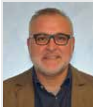
STEFANO PASQUINI Pianeta Bici di Pasquini Stefano. Sede Bagnolo Cremasco