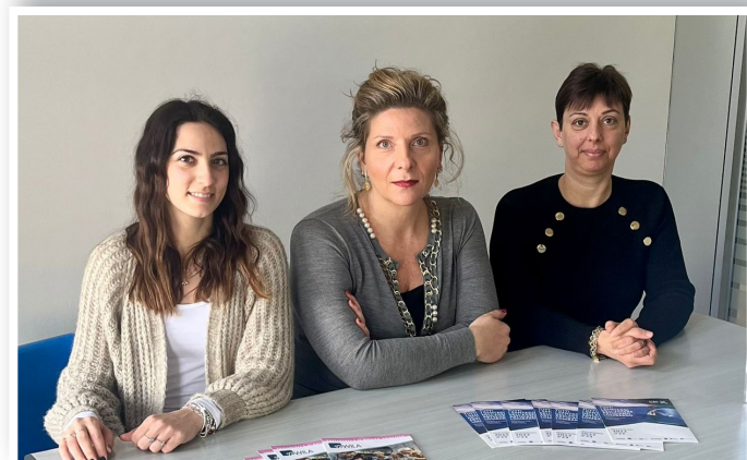
Le responsabili dello Sportello Elba, Wila e San.Arti della Libera

Tramite la Libera Associazione Artigiani - sportello territoriale di Casartigiani Lombardia - le imprese e i loro dipendenti nel 2022 hanno percepito quasi 80.000 euro di contributi. Numeri importanti erogati attraverso l'Ente bilaterale regionale - Elba - il fondo Wila, del welfare integrativo lombardo, e San.Arti, fondo di assistenza sanitaria