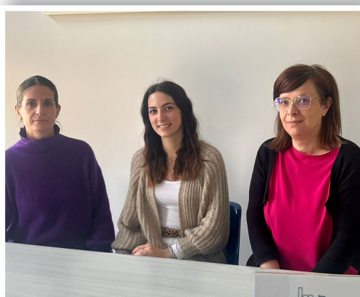
Le referenti dell'Ufficio 730 della Libera Artigiani

I pensionati devono presentare la dichiarazione dei redditi utilizzando il modello 730 se hanno percepito ulteriori redditi in aggiunta alla pensione, come ad esempio redditi da lavoro dipendente, redditi da fabbricati, redditi da terreni, redditi diversi, ecc. Il modello 730 è utilizzato per dichiarare i redditi percepiti nell'anno precedente e per calcolare l'eventuale saldo a debito o a credito con l'Agenzia delle Entrate.